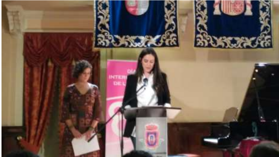
Lectura Manifiesto 8 de marzo.