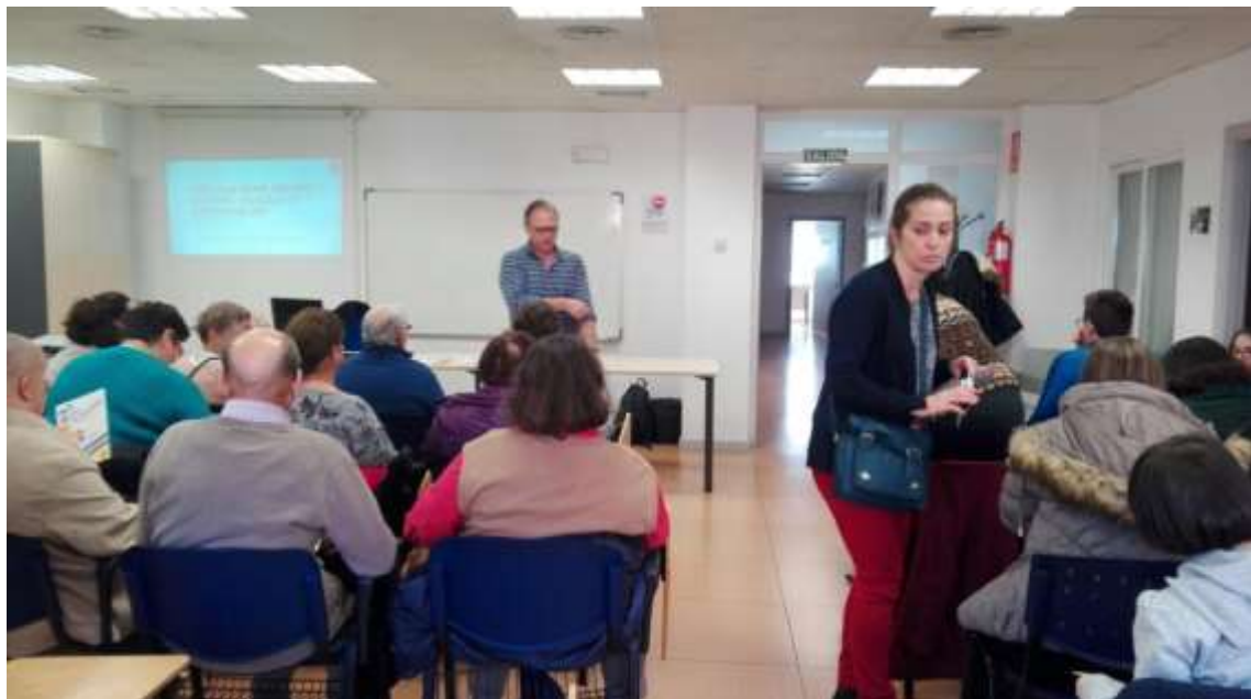
Talleres Igualdad de Oportunidades Dirigido a personas con Discapacidad Intelectual (Colaboración Plena Inclusión)

"Conocer nuestros derechos como hombres y mujeres nos ayuda a ir hacia una ciudadanía plena"