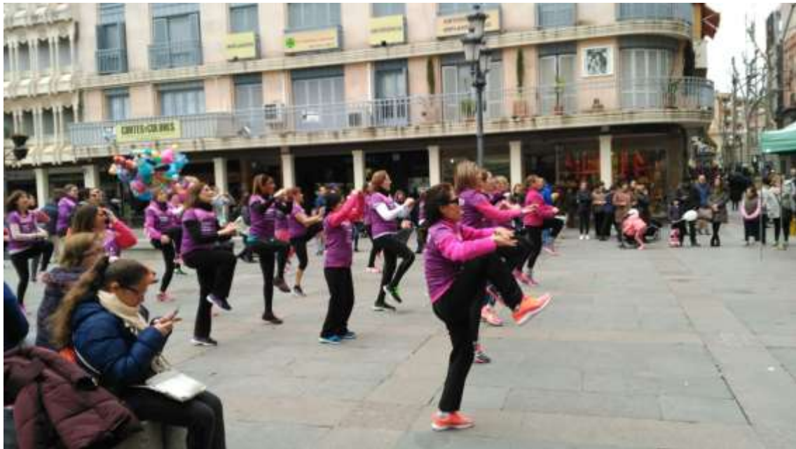
Actividades en torno 8 de marzo.