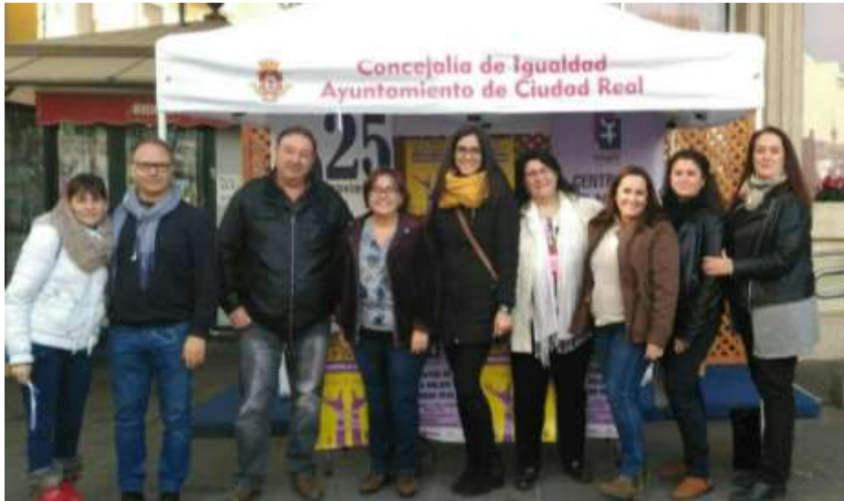
Mesa Informativa 25 N: "Ponle fin para tener un principio, Junt@s contra el