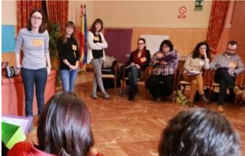
Curso de formación “Mujer e Islam”