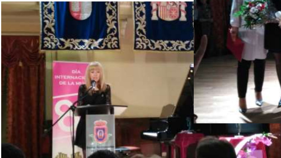
Premio Empoderamiento 2017