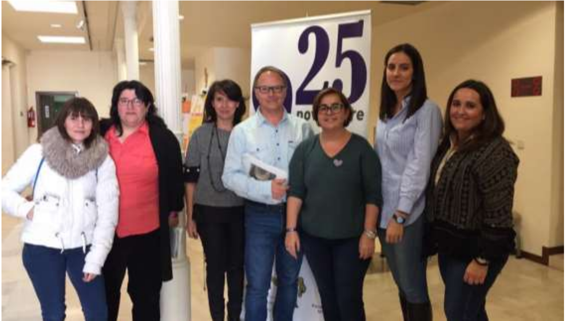
25N: Acto Institucional y lectura de manifiesto.