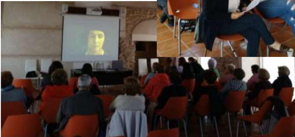
Café tertulia/Videoforum Clara Campoamor Carrión de Cva. (C.Real)