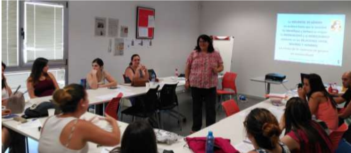
Taller de empleo: Ciudad Real Activa