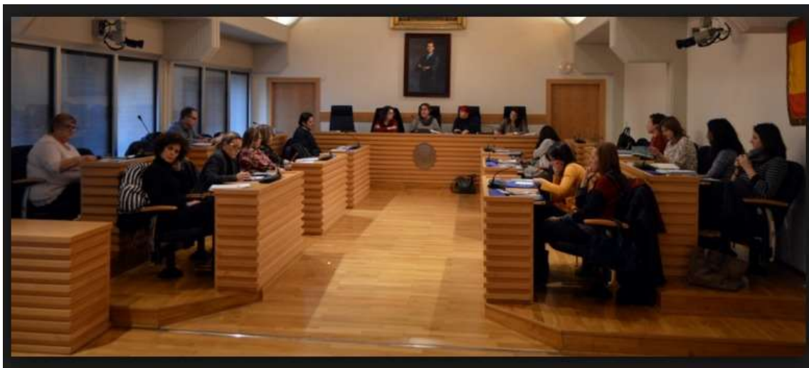
Consejo Local de la Mujer