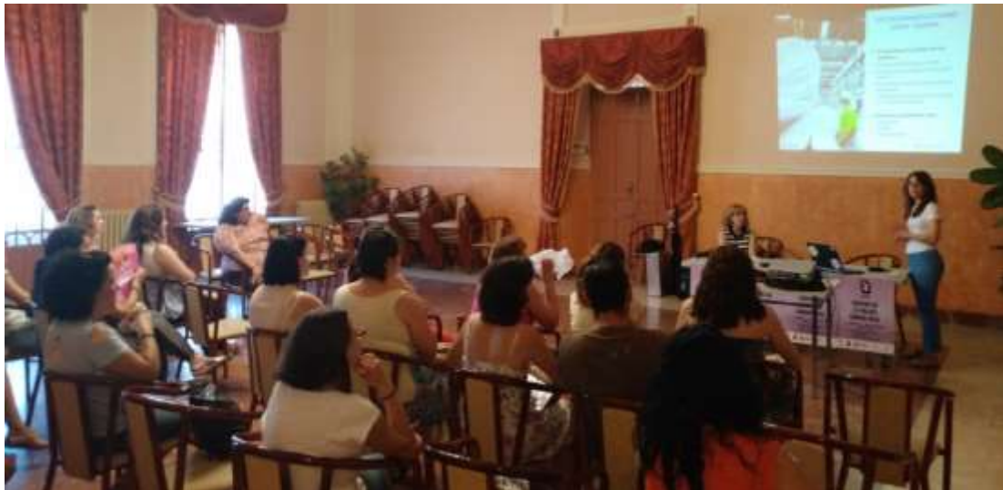
Charla Informativa, Empresa Vestas.