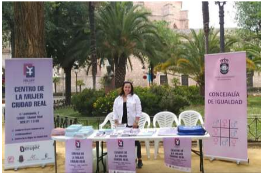
Clausura Talleres Mujer y Deporte.