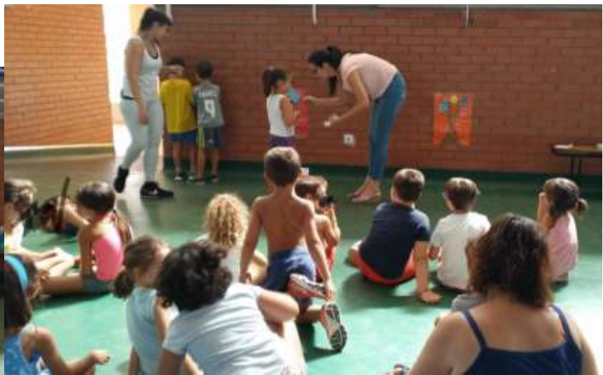
Talleres educativos de Corresponsabilidad.