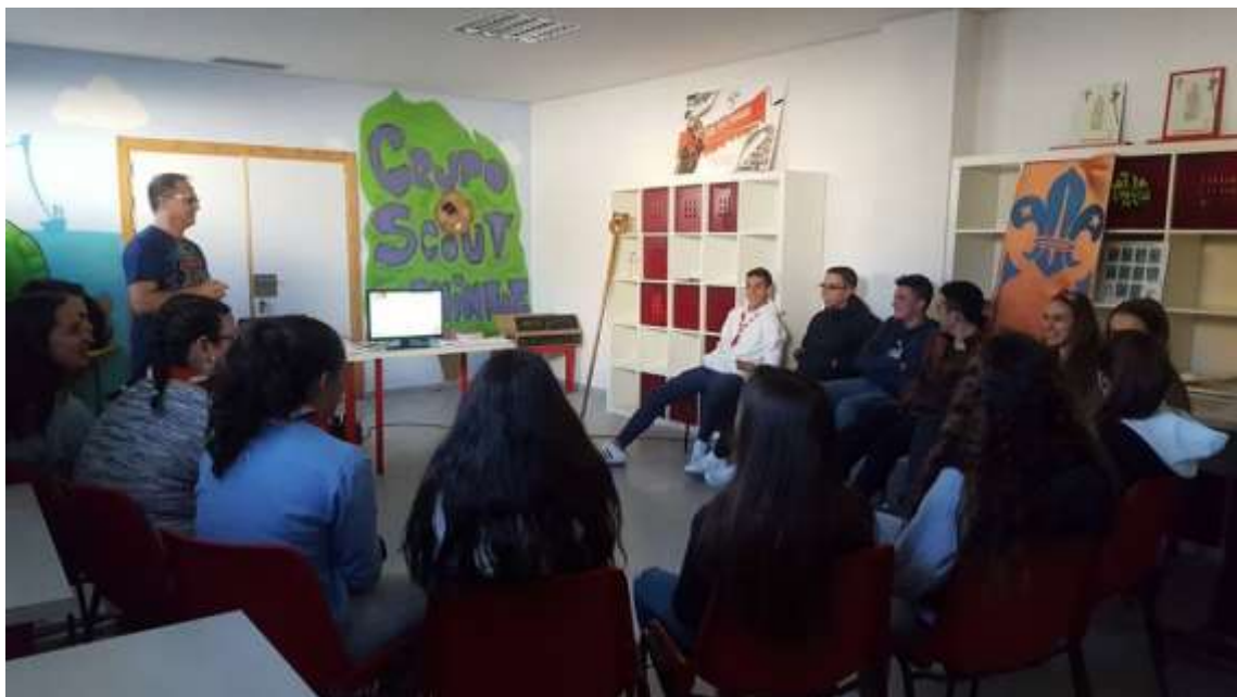
Talleres Igualdad de oportunidades: Secretariado Gitano.