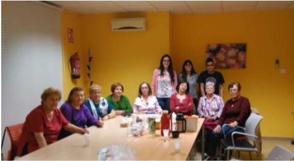
Café tertulia/Videoforum Clara Campoamor Poblete (C.Real)